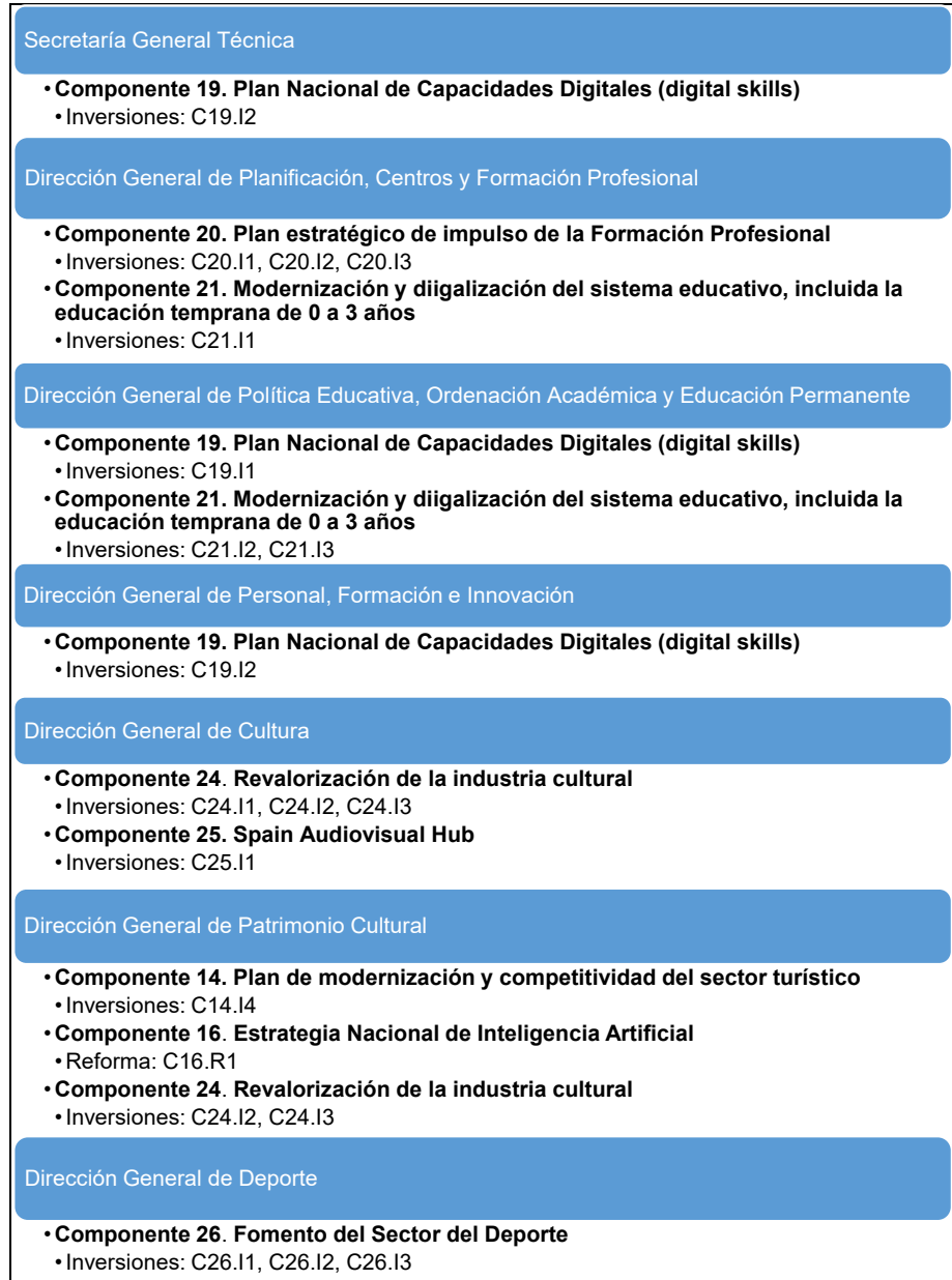
Figura 2. Distribución de los Componentes, Reformas e Inversiones que se gestionan en el Departamento de Educación, Cultura y Deporte

La Secretaría General Técnica del Departamento será quien realice la comprobación y análisis de los expedientes que identifiquen riesgos de fraude, de acuerdo con el procedimiento previsto en el apartado 6.3.1 de este Plan.